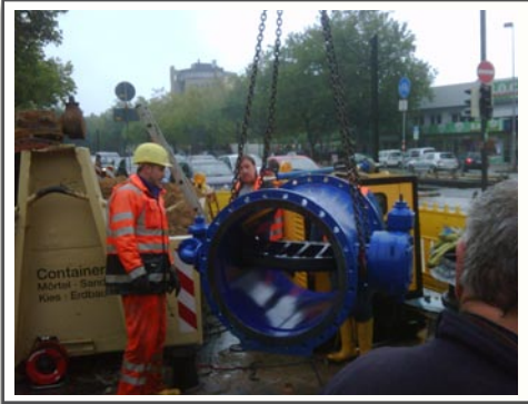
Neue Aufgaben, Neue Herausforderungen und Wasser, Wasser, Wasser