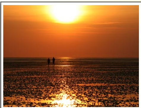
Cuxland Ferienparks Nordseeurlaub zu jeder Jahreszeit