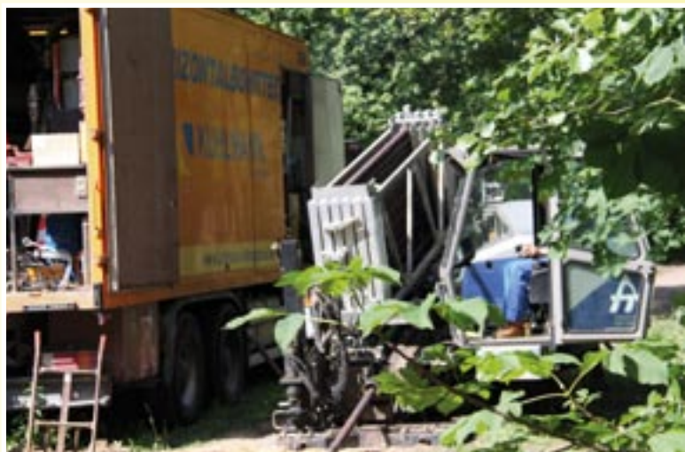
eine HDD-Anlage von Tracto Technik Grundodrill 15 N

Zunächst wird bei dem Kabel eine „Ölfreiheit“ hergestellt. Dazu wird optimalerweise an einem Hochpunkt das Kabel geschnitten und Druck auf das Innere des Kabels gegeben, damit das sich darin befindliche Öl an einem Tiefpunkt sammelt und abgelassen werden kann. Im weiteren Verlauf wird ca. alle 100 m ein Kopfloch erstellt, das Kabel an diesen Stellen getrennt und die Kabelenden abgeschumpft, damit kein Restöl auslaufen kann.