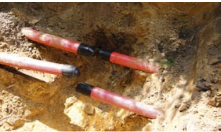
zwei für das „Ausbohren“ geschnittene 60 kV Ölkabel

Sobald der Bohrkopf die Zielgrube erreicht hat, kann das Kabel entweder aus der Start- oder der Zielgrube mit einem Bagger oder Radlager unter Zuhilfenahme eines Ziehstrumpfes herausgezogen werden.