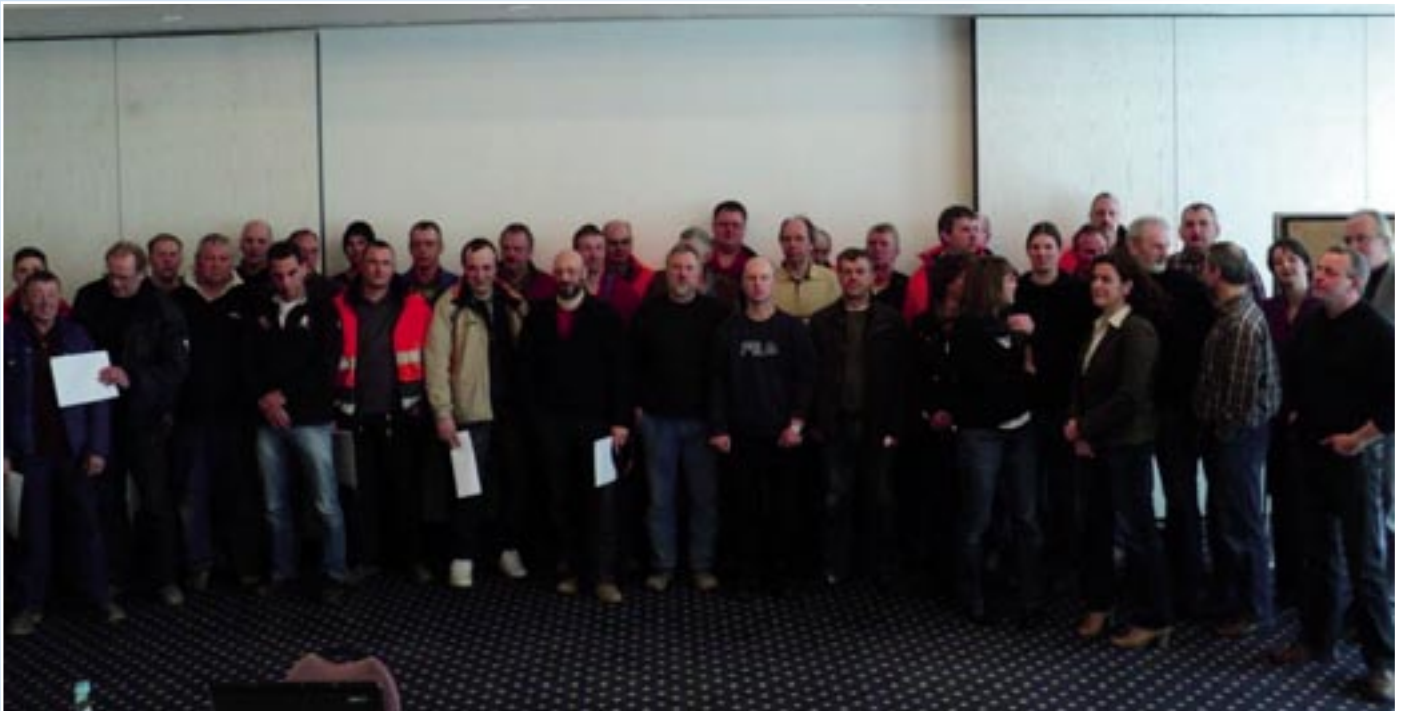
Die neuen Kollegen aus Schleswig-Holstein

Die neuen Kollegen in Bad Bramstedt haben auch schon eine lange Tradition im Rohrleitungsbau und bei vielen